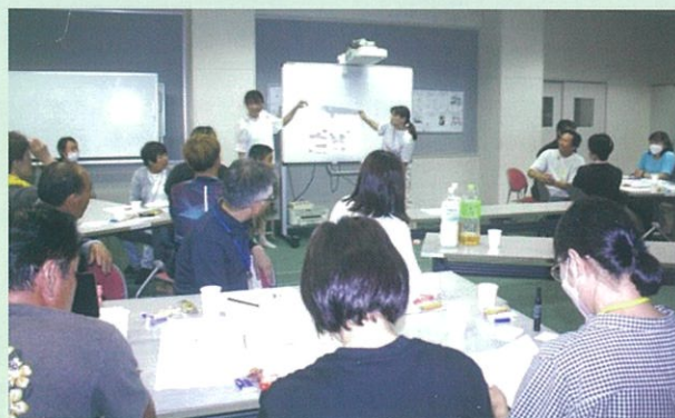
下米田小学校“サポーター交流会”の様子。夏休み最後の金曜日の夜にもかかわらず、30人以上のボランティアをされている方が集まりました。